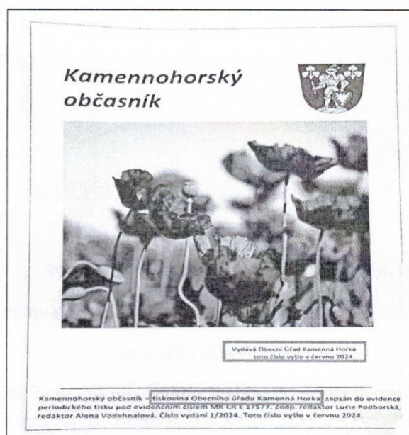
Scan Kamennohorského občasníku 06/2024